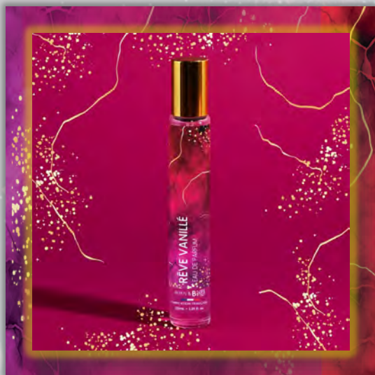
RÊVE VANILLÉ 30ml

Новинка в мире ароматов, парфюмерная вода BORN TO BIO из Vichy от LABORATOIRE BIO SEASONS, – истинное свидетельство приверженности KOSMEO FRANCIA качеству и инновациям. KOSMEO FRANCIA, официальный представитель и дистрибьютор в странах Евразии, представляет этот новый аромат как праздник природы и благополучия. Благодаря изысканным нотам и тщательно подобранным органическим ингредиентам, BORN TO BIO воплощает в себе самую суть ответственной и экологичной красоты. Эта элегантная и аутентичная парфюмерная вода пленяет своим уникальным характером, привлекая тех, кто ищет новые, насыщенные обонятельные ощущения.