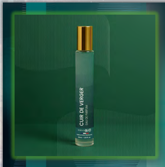
CUIR DE VERGER 30ml

Древесный и фруктовый мужской аромат, в котором свежее яблоко сочетается с теплотой кедра и мускуса.