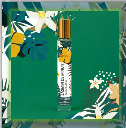
JASMIN DE MINUIT 30ml

Цветочный и чувственный женский аромат, в котором жасмин сияет на основе ванили и мускуса, создавая элегантность, неподвластную времени.