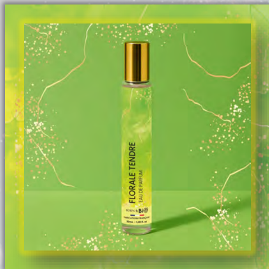
FLORALE TENDRE 30ml

Новинка в мире ароматов, парфюмерная вода BORN TO BIO из Vichy от LABORATOIRE BIO SEASONS, – истинное свидетельство приверженности KOSMEO FRANCIA качеству и инновациям. KOSMEO FRANCIA, официальный представитель и дистрибьютор в странах Евразии, представляет этот новый аромат как праздник природы и благополучия. Благодаря изысканным нотам и тщательно подобранным органическим ингредиентам, BORN TO BIO воплощает в себе самую суть ответственной и экологичной красоты. Эта элегантная и аутентичная парфюмерная вода пленяет своим уникальным характером, привлекая тех, кто ищет новые, насыщенные обонятельные ощущения.