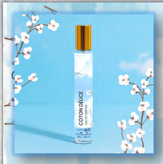
COTON DÉLICE 30ml

ALCOHOL DENAT (ДЕНАТУРИРОВАННЫЙ СПИРТ), PARFUM (ОТДУШКА), AQUA (ВОДА), LINALOOL (ЛИНАЛООЛ), TETRAMETHYL ACETYLOSTANHYDRONAPHTHALENES (ТЕТРАМЕТИЛ АЦЕТИЛОКТАГИДРОНАФТАЛЕНЬ), VANILLIN (ВАНИЛИН), LIMONENE (ЛИМОНЕН), LINALYL ACETATE (ЛИНАЛИЛАЦЕТАТ), GERANIOL (ГЕРАНИОЛ), HEXYL CINNAMAL (ГЕКСИЛЦИННАМАЛ), BENZYL SALICYLATE (БЕНЗИЛСАЛИЦИЛАТ), CITRONELLOL (ЦИТРОНЕЛЛОЛ), COUMARIN (КУМАРИН), PINENE (ПИНЕН), CITRAL (ЦИТРАЛ), ROSE KETONES (РОЗОВЫЕ КЕТОНЫ), GERANYL ACETATE (ГЕРАНИЛАЦЕТАТ), ALPHA ISOMETHYL IONONE (АЛЬФА-ИЗОМЕТИЛИОНОН), HYDROXYCITRONELLAL (ГИДРОКСИЦИТРОНЕЛЛАЛ), BENZYL BENZOATE (БЕНЗИЛБЕНЗОАТ), BETA-CARYOPHYLLENE (БЕТА-КАРИОФИЛЛЕН).