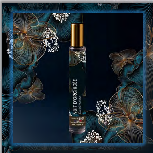
NUIT D'ORCHIDÉE 30ml

Новинка в мире ароматов, парфюмерная вода BORN TO BIO из Vichy от LABORATOIRE BIO SEASONS, – истинное свидетельство приверженности KOSMEO FRANCIA качеству и инновациям. KOSMEO FRANCIA, официальный представитель и дистрибьютор в странах Евразии, представляет этот новый аромат как праздник природы и благополучия. Благодаря изысканным нотам и тщательно подобранным органическим ингредиентам, BORN TO BIO воплощает в себе самую суть ответственной и экологичной красоты. Эта элегантная и аутентичная парфюмерная вода пленяет своим уникальным характером, привлекая тех, кто ищет новые, насыщенные обонятельные ощущения.