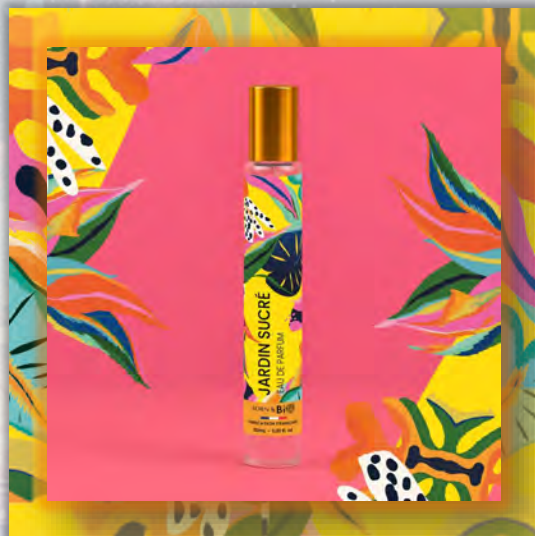
JARDIN SUCRÉ 30ml

ALCOHOL DENAT (ДЕНАТУРИРОВАННЫЙ СПИРТ), PARFUM (ОТДУШКА), AQUA (ВОДА), TETRAMETHYL ACETYLOSTANУDRONАРНТНАLENES (ТЕТРАМЕТИЛ АЦЕТИЛОКТАГИДРОНАФТАЛЕНЬ), LINALOOL (ЛИНАЛООЛ), LIMONENE (ЛИМОНЕН), VANILLIN (ВАНИЛИН), HEXYL CINNAMAL (ГЕКСИЛЦИННАМАЛ), BENZYL SALICYLATE (БЕНЗИЛСАЛИЦИЛАТ), LINALYL ACETATE (ЛИНАЛИЛАЦЕТАТ), COUMARIN (КУМАРИН), GERANIOL (ГЕРАНИОЛ), BENZYL BENZOATE (БЕНЗИЛБЕНЗОАТ), ACETYL CEDRENE (АЦЕТИЛКЕДРЕН), ALPHA ISOMETHYL IONONE (АЛЬФА-ИЗОМЕТИЛИОНОН), CITRAL (ЦИТРАЛ), BENZOIN RESINOID (БЕНЗОИНОВАЯ СМОЛА), BETA-CARYOPHYLLENE (БЕТА-КАРИОФИЛЛЕН), BENZYL ALCOHOL (БЕНЗИЛОВЫЙ СПИРТ).