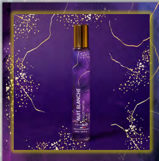
NUIT BLANCHE 30ml

ALCOHOL DENAT (ДЕНАТУРИРОВАННЫЙ СПИРТ), PARFUM (ОТДУШКА), AQUA (ВОДА), LINALOOL (ЛИНАЛОЛ), LIMONENE (ЛИМОНЕН), BENZYL SALICYLATE (БЕНЗИЛСАЛИЦИЛАТ), HEXYL CINNAMAL (ГЕКСИЛЦИННАМАЛ), LINALYL ACETATE (ЛИНАЛИЛАЦЕТАТ), VANILLIN (ВАНИЛИН), CITRAL (ЦИТРАЛ), GERANIOL (ГЕРАНИОЛ), COUMARIN (КУМАРИН), BENZYL BENZOATE (БЕНЗИЛБЕНЗОАТ), TERPINEOL (ТЕРПИНЕОЛ), CITRONELLOL (ЦИТРОНЕЛЛОЛ), PINENE (ПИНЕН), GERANYL ACETATE (ГЕРАНИЛАЦЕТАТ), BETA-CARYOPHYLLENE (БЕТА-КАРИОФИЛЛЕН).