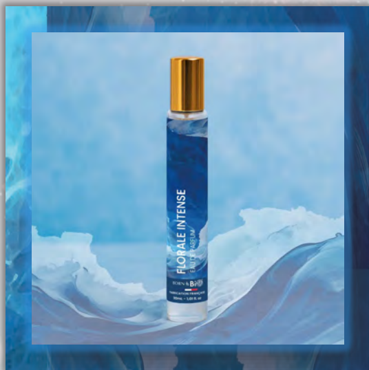
FLORALE INTENSE 30ml

Новинка в мире ароматов, парфюмерная вода BORN TO BIO из Vichy от LABORATOIRE BIO SEASONS, – истинное свидетельство приверженности KOSMEO FRANCIA качеству и инновациям. KOSMEO FRANCIA, официальный представитель и дистрибьютор в странах Евразии, представляет этот новый аромат как праздник природы и благополучия. Благодаря изысканным нотам и тщательно подобранным органическим ингредиентам, BORN TO BIO воплощает в себе самую суть ответственной и экологичной красоты. Эта элегантная и аутентичная парфюмерная вода пленяет своим уникальным характером, привлекая тех, кто ищет новые, насыщенные обонятельные ощущения.