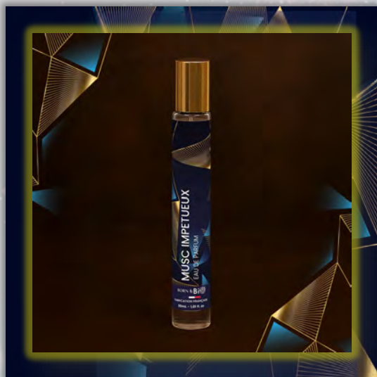
MUSC IMPETUEUX 30ml

Новинка в мире ароматов, парфюмерная вода BORN TO BIO из Vichy от LABORATOIRE BIO SEASONS, – истинное свидетельство приверженности KOSMEO FRANCIA качеству и инновациям. KOSMEO FRANCIA, официальный представитель и дистрибьютор в странах Евразии, представляет этот новый аромат как праздник природы и благополучия. Благодаря изысканным нотам и тщательно подобранным органическим ингредиентам, BORN TO BIO воплощает в себе самую суть ответственной и экологичной красоты. Эта элегантная и аутентичная парфюмерная вода пленяет своим уникальным характером, привлекая тех, кто ищет новые, насыщенные обонятельные ощущения.